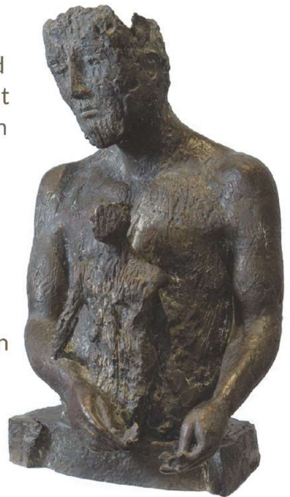
NINA KOCH, PROMETHEUS, 1996, 54 x 35 x 30 CM

Der Künstlersonderbund in Deutschland 1990 - Realismus der Gegenwart e. V. ist ein Zusammenschluss von Künstlerinnen und Künstlern, die in ihrer kreativen, individuellen Ausprägung den gegenständlich-figurativen Realismus vertreten und diese Position mit Unterstützung ihrer Fördermitglieder sichtbar machen. In Berlin Kreuzberg haben sie Ihren Geschäftssitz und zeigen dort in ihrer Realismus Galerie und vielen deutschen Städten Werke ihrer Mitglieder.