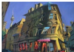
Dom & Brücke, 2023 Öl, 90 x 120 cm Refuge Sophienneck, 2009 Öl, 80 x 100 cm